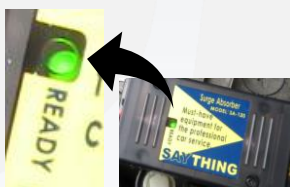
視認性の高い LED接続確認灯